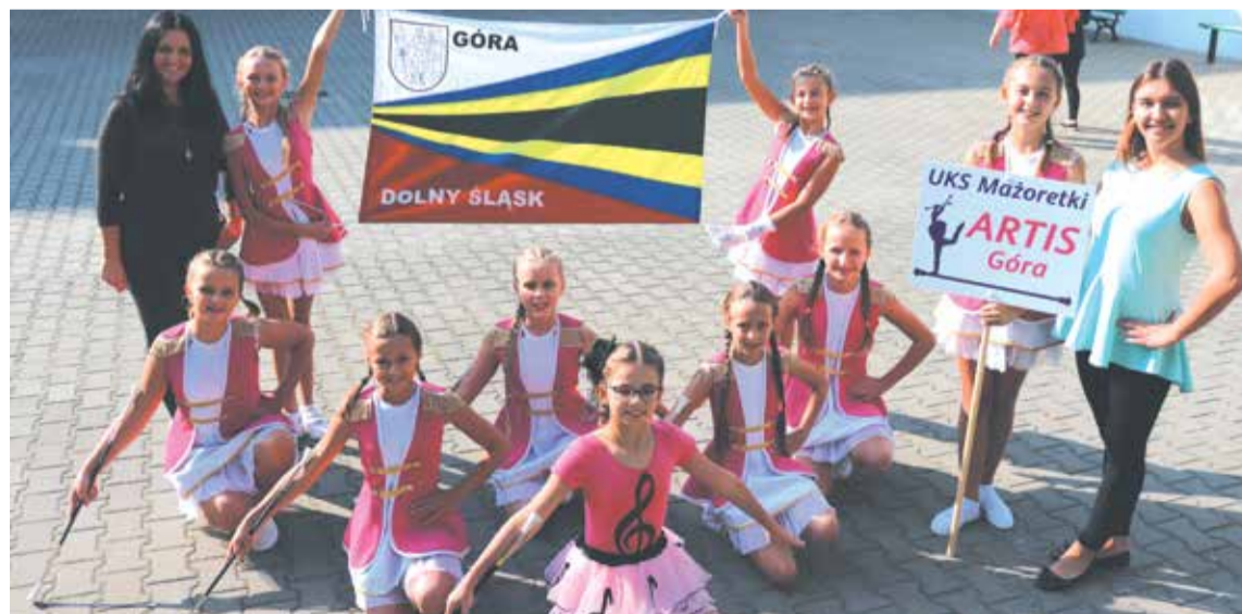
Tekst Natalia Skoczylas

osobowym zaprezentowała się w kategorii show kadetki. Dziewczyny swoim tańcem przedstawiły kolorowy „Świat smurfów” zajmując 1 miejsce. Jak widać, nie liczy się ilość, a jakość. Z ogromną radością i zadowoleniem, wzruszeniem i jeszcze większą motywacją do pracy wróciliśmy do Góry. Podziękowania składamy dla Urzędu Miasta i Gminy Góra za możliwość reprezentowania naszego miasta na tak wspaniałym konkursie oraz okazaną pomoc – w postaci z finansowania naszego wyjazdu.