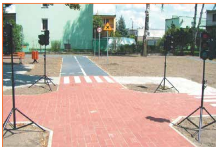
Wykonanie miasteczka ruchu drogowego przy Szkole Podstawowej Nr 1 w Górze.

Termomodernizacja remizy strażackiej w Osetnie, oraz remont toalet i wykonanie c.o.