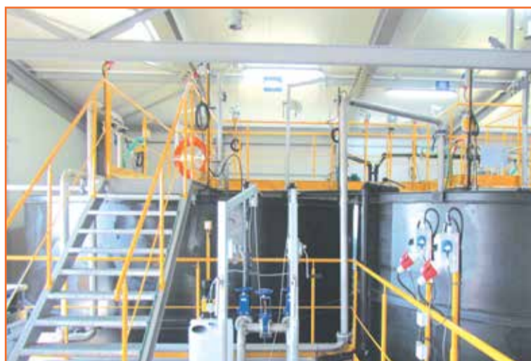
Oczyszczalnia ścieków w Czerninie Dolnej.

Zrealizowane inwestycje w zakresie bezpieczeństwa i środowiska: