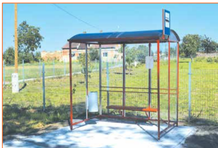
Zakup i montaż wiat przystankowych.

Przebudowa zbiornika wodnego w Witoszycach.